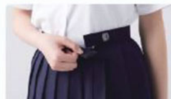
ワンタッチアジャスター