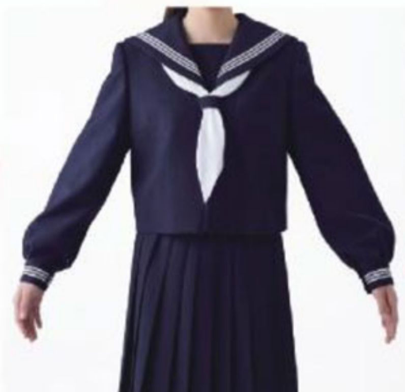
従来のシルエット